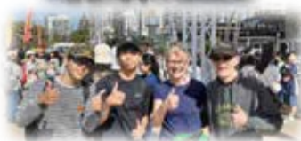
グローバルな人材を育成 ホストファミリーとのふれあい(7月) オーストラリア語学研修(希望者)