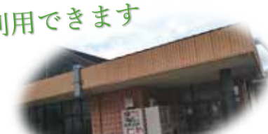
弁当を持ち込んでの飲食OK！ 生徒の憩いと団らんにもなっています。