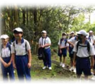
ふるさと山口 歴史街道を歩く(9月) 萩往還ウォーク(1, 2年生)