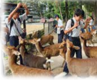
中学時代の思い出づくり(10月) 京都、奈良の世界遺産めぐり USJ 修学旅行(3年生)