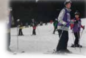
古来よりの元服の儀に習い 志を新たに(3月) 立志式