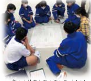
新たな仲間と絆を深める(4月) オリエンテーション宿泊研修(1年生)