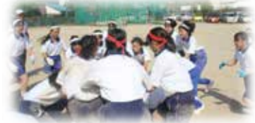
高校生とともに 縦割り演習する運動会(9月) 晃英祭(体育の部)